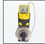
Чехол для крепления на ремне