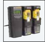
Совместимость с MicroDock II