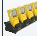
Док-станция зарядки нескольких устройств