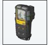
Противоударный защитный кожух

Полный список принадлежностей можно получить, связавшись с компанией BW Technologies by Honeywell.